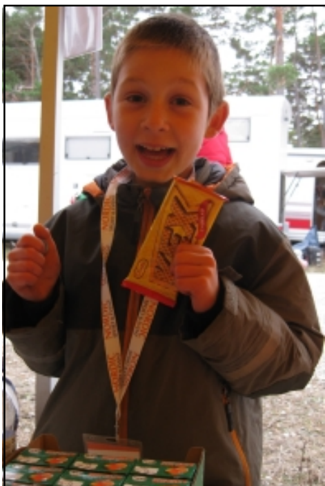
Glad kexchokladörsäljare i Anderssons-Franssons kiosk

Nytt för i år var att vi hade konkurrens i försäljningen av våra hamburgare och kioskvaror. På det nya Mattorget fanns även Pastavagnen, Mr Panini och en Wokförsäljare, som gjorde sitt bästa för att dra till sig kunder. Den gamla pyttipannan har tagits bort av tävlingsarrangören och idén är nu att kunna erbjuda åskådarna och förarna ett bredare utbud av varor.