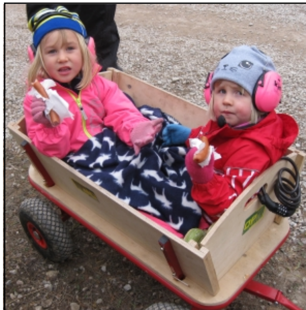
Korven smakar som bäst under GGN. OBS! Tjejernas hörselskydd!

möjligt. Det var endast på lördagen som vi hade alla fem kiosken igång, övriga dagar var det bara öppet i depåkiosken, vilket underlättade för oss. Tältresningen sköttes av ett 10-tal VOK-are på onsdagen innan tävlingarna.